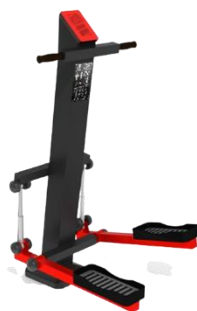
- Simulador de Escadas GYM 13