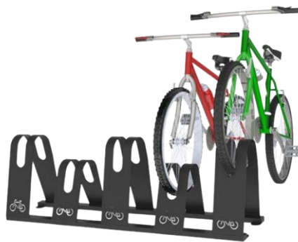
- Suporte para bicicletas SUP F18 AL