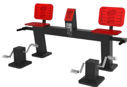
- Pedaleiras FIT 17